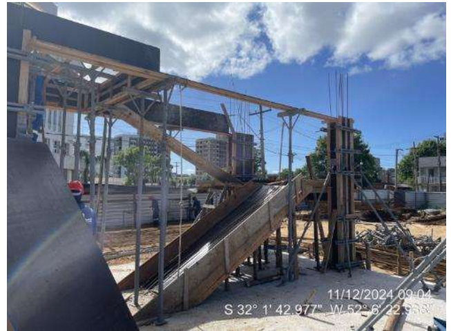
- Forma Escada (Ala Sul);