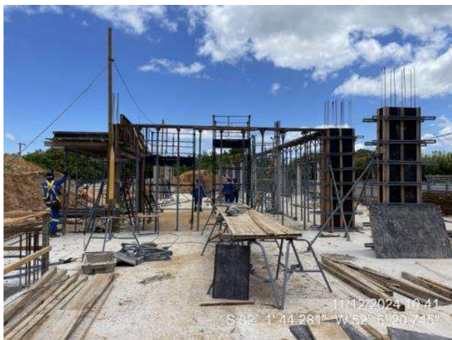
- Formas das Lajes (2º Pav. Ala Leste);