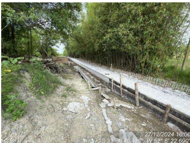
- Trecho da sapata corrida do gradil;