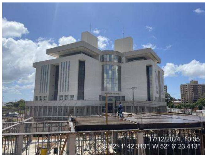
Formas das Lajes (2º Pav. Ala Leste);