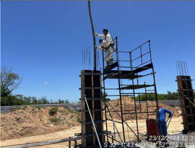
- Concretagem dos pilares do térreo da Ala Sul;