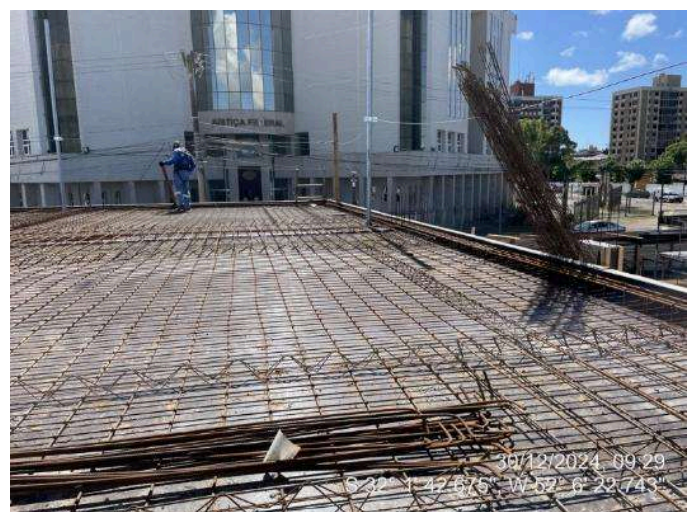
- Armação Lajes (2º Pav Ala Leste);