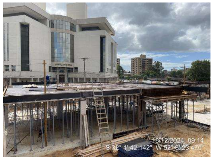
Armação Vigas (2º Pav Ala Leste);