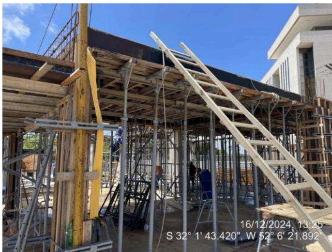
- Formas das Lajes (2º Pav. Ala Leste);