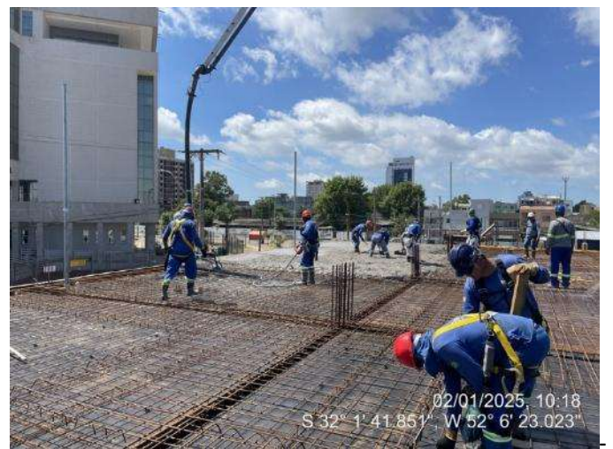
Concretagem Lajes e Vigas (2º Pav Ala Leste);