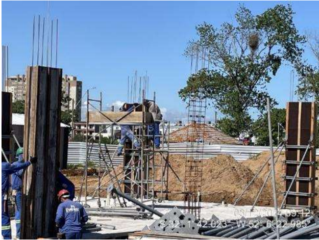
Armação dos pilares do térreo ala sul;