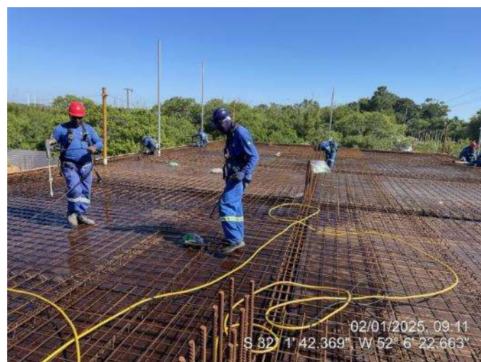
-Armação Lajes (2º Pav Ala Leste);