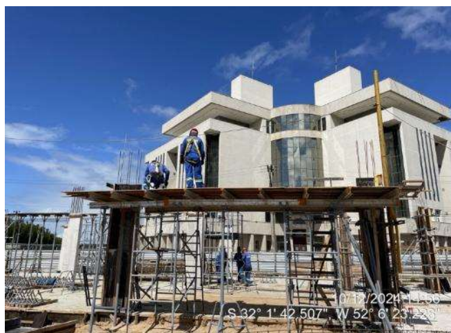
- Formas das Lajes (2º Pav. Ala Leste);