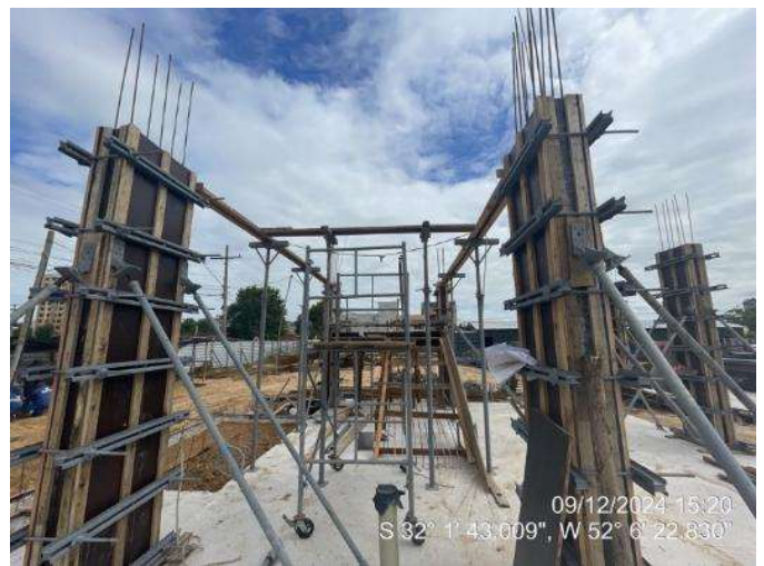
- Formas das Lajes (2º Pav. Ala Leste);