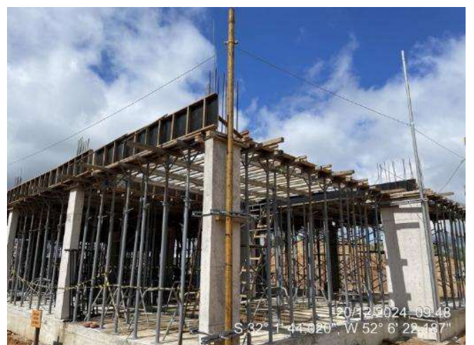
Formas das Lajes (2º Pav. Ala Leste);