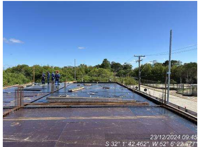
- Formas das lajes (2º Pav. Ala Leste);