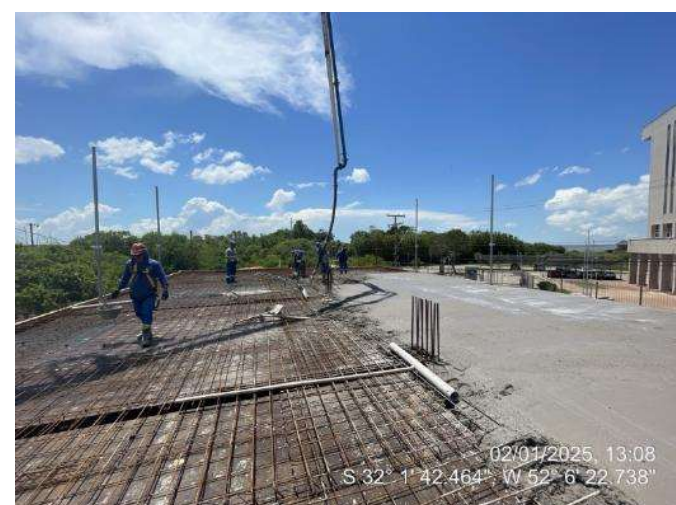
- Concretagem Lajes e Vigas (2º Pav Ala Leste);