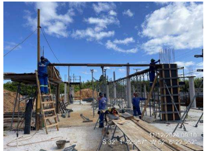
- Formas das Lajes (2º Pav. Ala Leste);