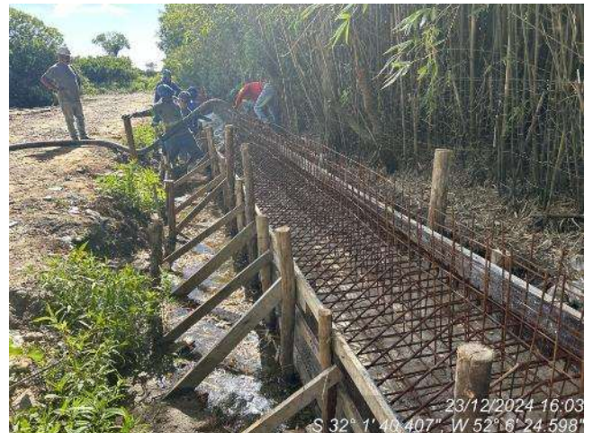
- Concretagem da sapata corrida do gradil;