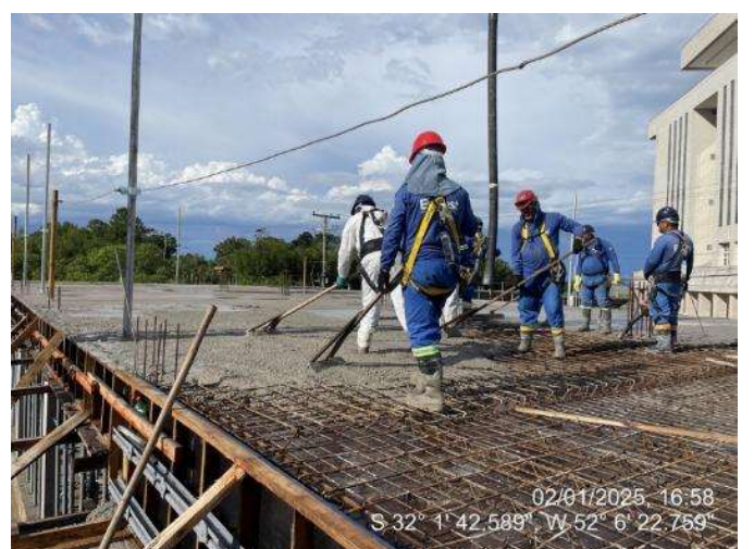
Concretagem Lajes e Vigas (2º Pav Ala Leste);