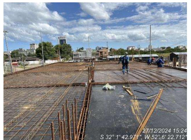
- Armação vigas e lajes (2º Pav Ala Leste);