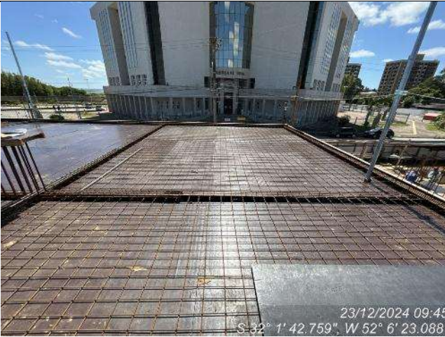
- Armação vigas e lajes (2º Pav Ala Leste);