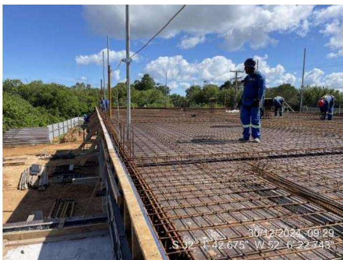
- Armação Lajes (2º Pav Ala Leste);