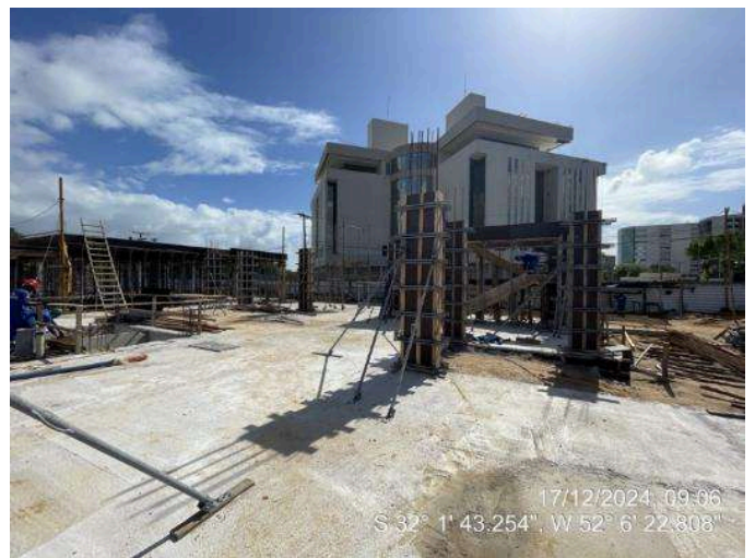
- Formas dos pilares do térreo ala sul;