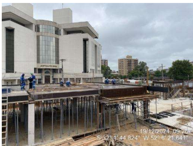
Armação Vigas (2º Pav Ala Leste);