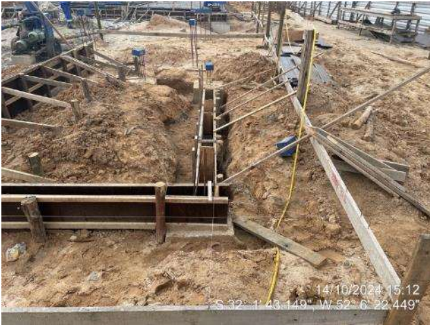
Montagem de formas e armaduras das vigas de fundação