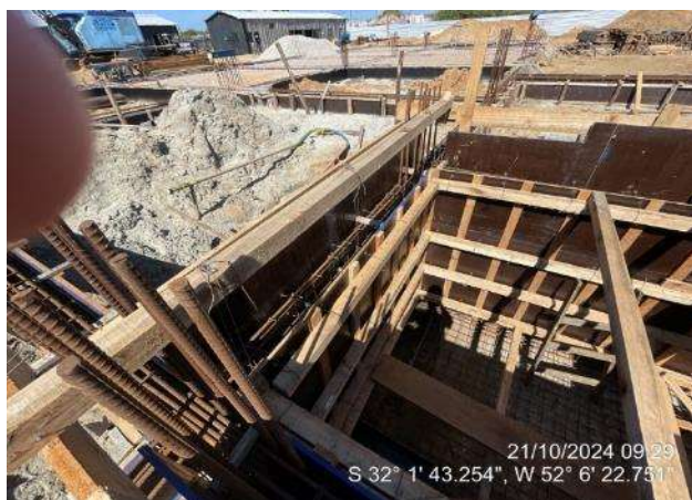
Montagem de formas e armaduras das vigas do elevador