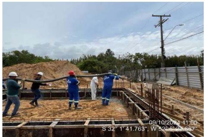
Concretagem das vigas de fundação