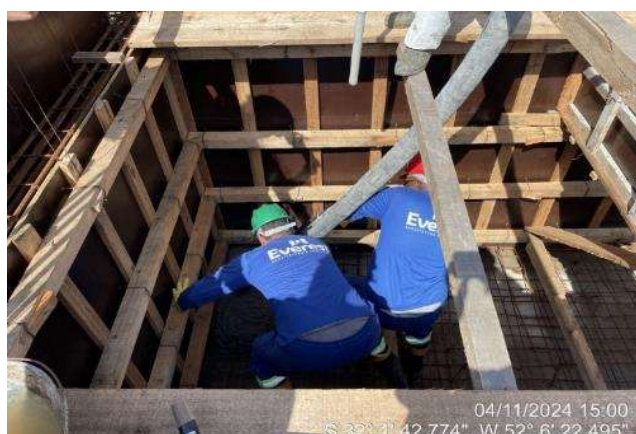
Concretagem laje de fundo elevador