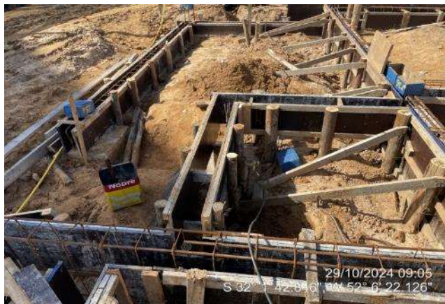
Montagem das armaduras das vigas de fundações