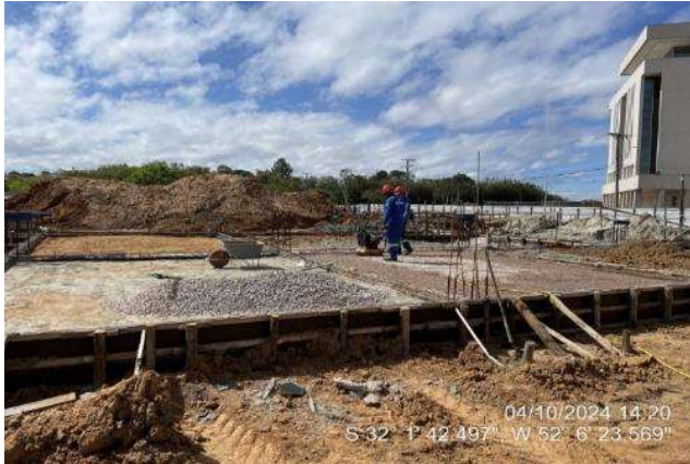
Colocação das camadas de aterro e brita compactados