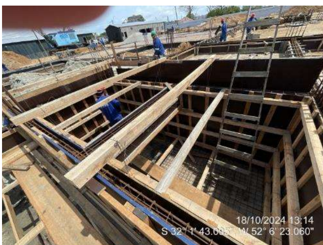
- Montagem de formas e armaduras das vigas do elevador