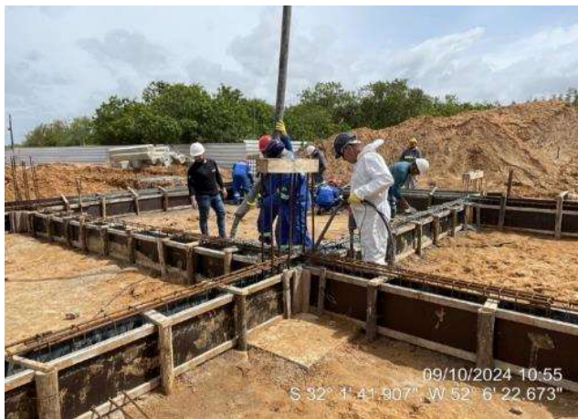
Concretagem das vigas de fundação