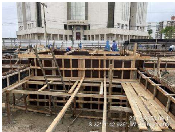
Montagem de formas e armaduras das vigas do elevador