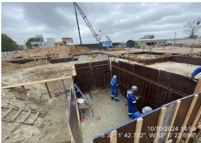
Montagem de formas e armaduras das vigas do elevador