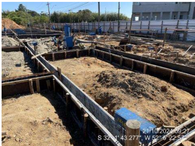
Montagem das armaduras das vigas de fundações