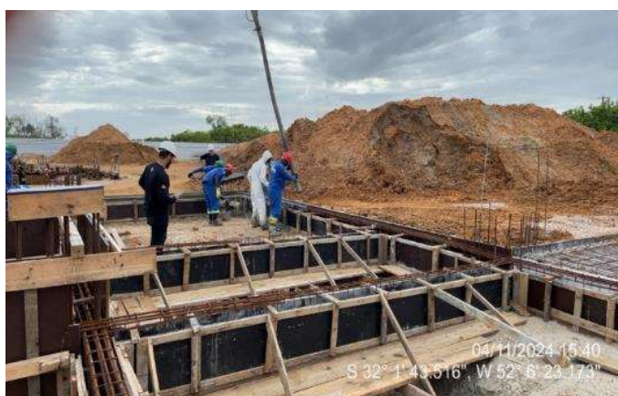
Concretagem vigas de fundação e elevador