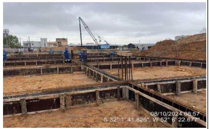
Montagem de formas e armaduras das vigas de fundação