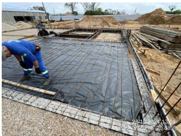
Colocação das armaduras positivas das lajes