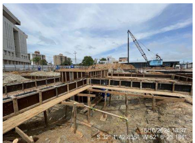
- Montagem de formas e armaduras das vigas do elevador