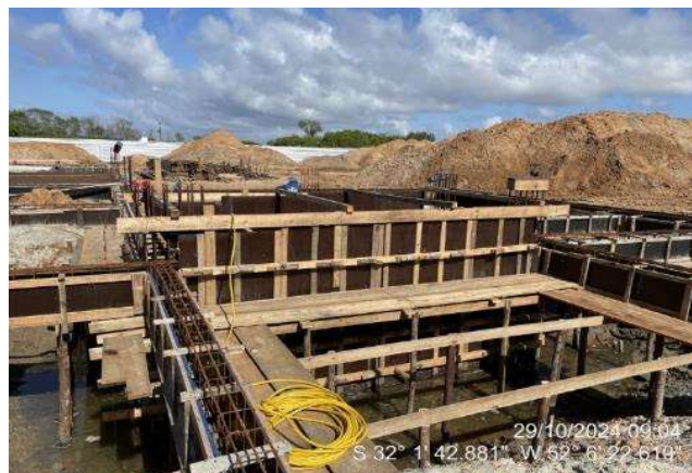
Montagem de formas e armaduras das vigas do elevador