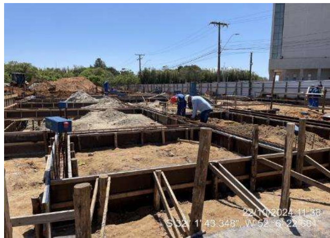
Montagem das armaduras das vigas de fundações