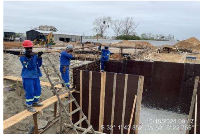
Montagem de formas e armaduras das vigas do elevador