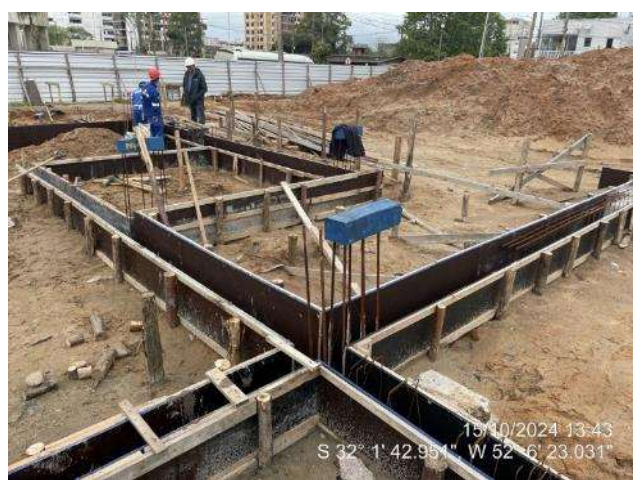
Montagem de formas e armaduras das vigas de fundação