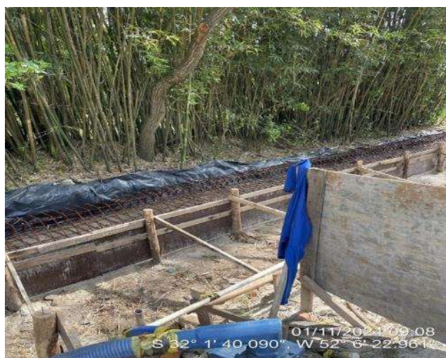
Estrutura da sapata corrida