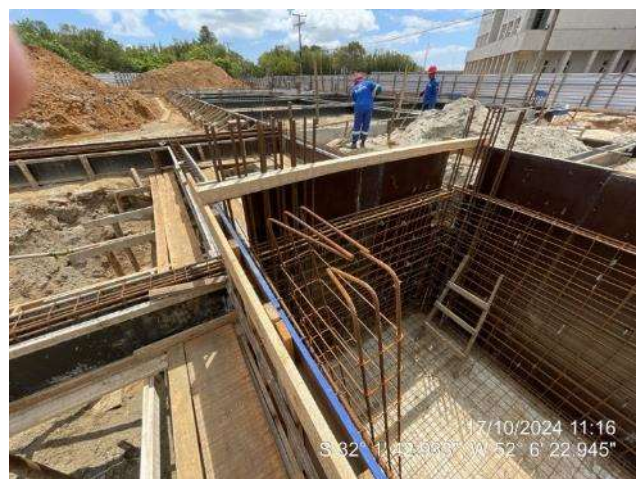
Montagem de formas e armaduras das vigas do elevador