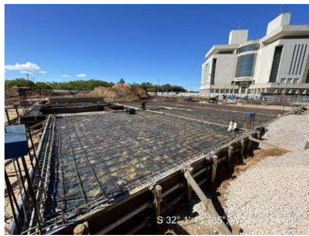
Colocação das armaduras positivas das lajes