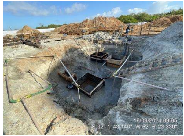
- Rebaixamento do lençol freático