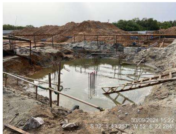
- Rebaixamento do lençol freático