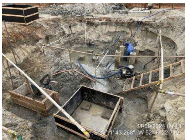
- Montagem de formas e armaduras dos blocos de fundação do elevador