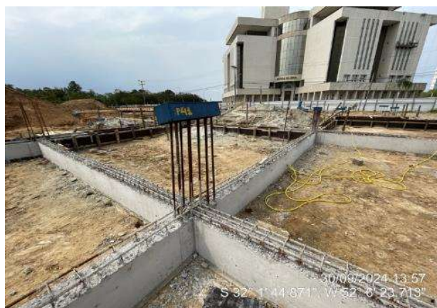
- Vigas de fundação concretadas