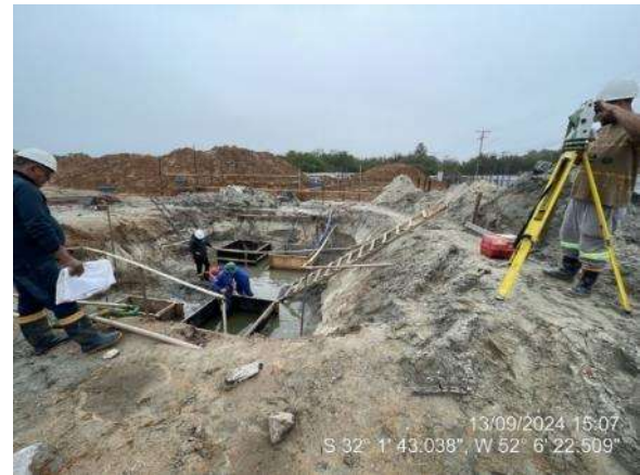
- Marcação de eixos dos blocos de fundação do elevador