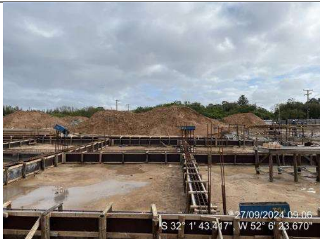
- Montagem das armaduras das vigas de fundações