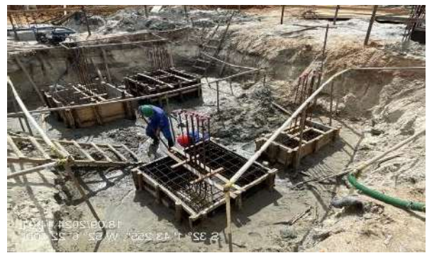
- Montagem de formas e armaduras dos blocos do poço do elevador