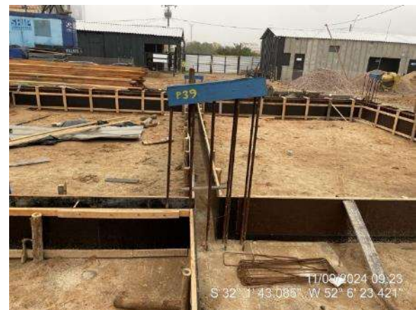
- Montagem de formas e armaduras das vigas de fundação