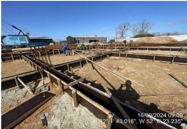
- Montagem de formas das vigas de fundação