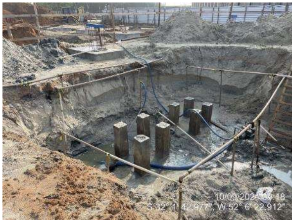
- Rebaixamento do lençol freático