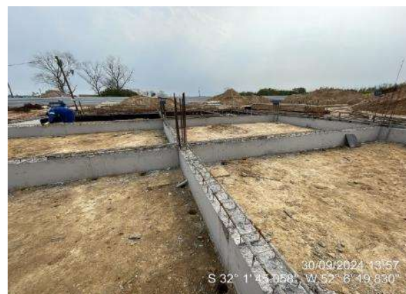
- Concretagem das vigas de fundação