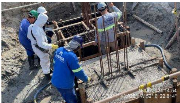
- Concretagem dos blocos do poço do elevador