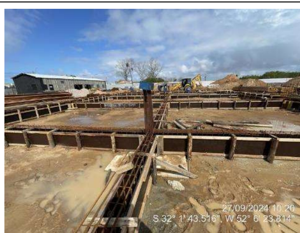
- Montagem das armaduras das vigas de fundações