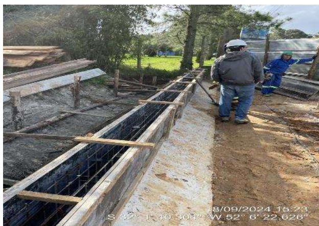
- Concretagem do trecho do Gradil 5