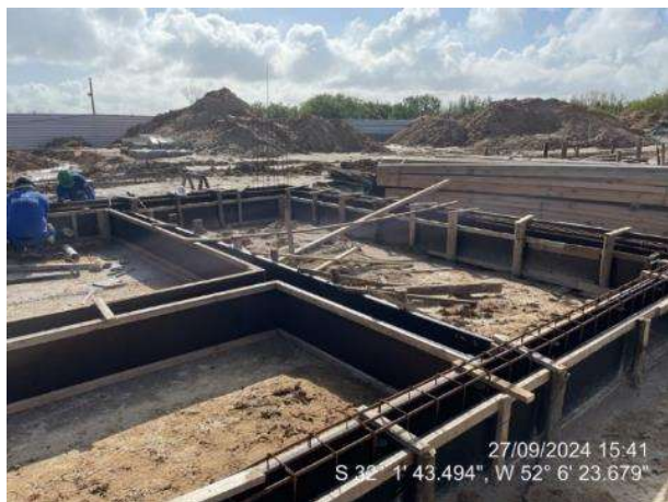
- Montagem das armaduras das vigas de fundações