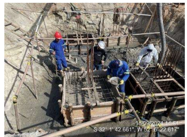
- Concretagem do poço do elevador