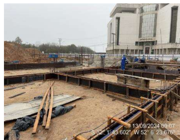
- Montagem de formas e armaduras das vigas de fundação