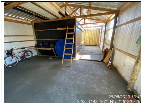
Dia 28/08 – Instalações provisórias