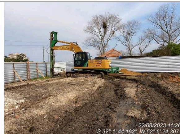
Dia 22/08 – Perfuratriz de geodrenos