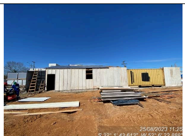
Dia 25/08 – Instalações provisórias