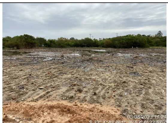
Dia 03/08 – Condição do canteiro