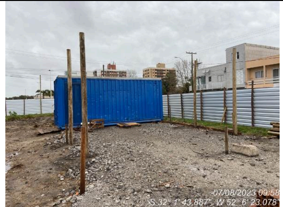
Dia 07/08 – Instalações provisórias