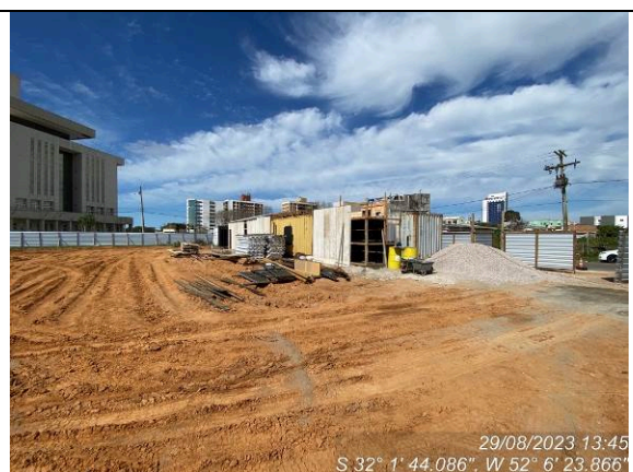
Dia 29/08 – Instalações provisórias