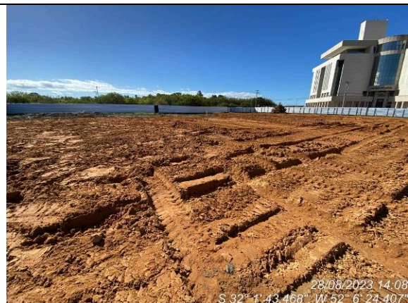
Dia 28/08 – Geral canteiro