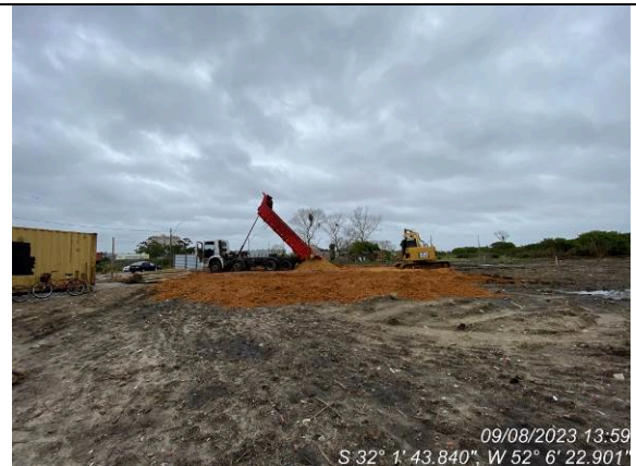
Dia 09/08 – Aterro de nivelamento do terreno