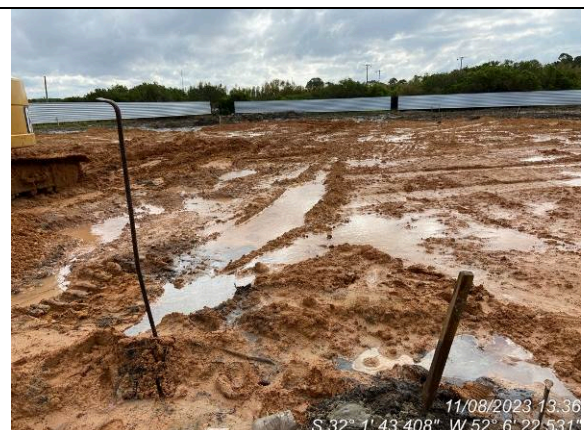
Dia 11/08 – Condição do canteiro