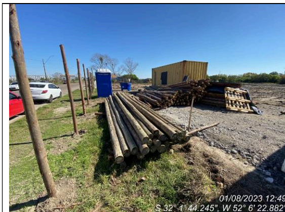
Dia 01/08 – Execução do tapume