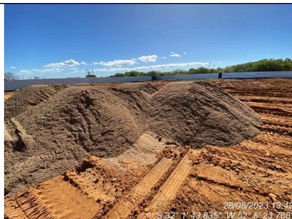
Dia 28/08 – Areia para camada drenante