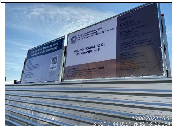
Dia 10/08 – Placa da obra