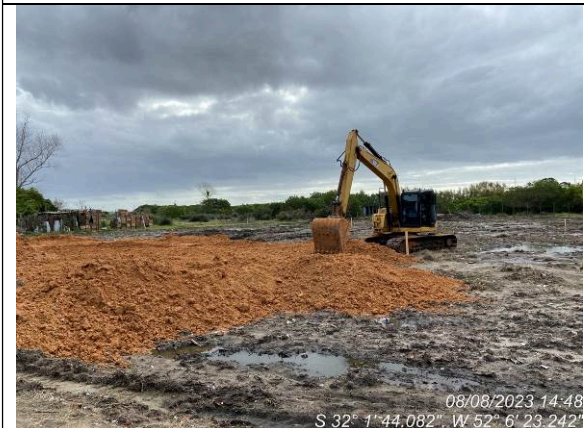
Dia 08/08 – Aterro de nivelamento do terreno