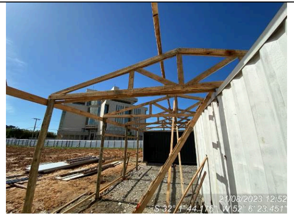
Dia 21/08 – Instalações provisórias