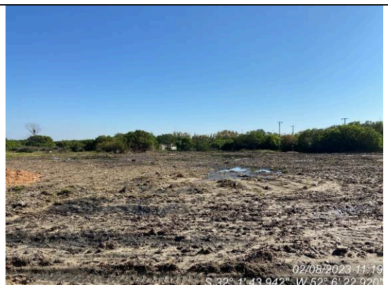
Dia 02/08 – Geral canteiro