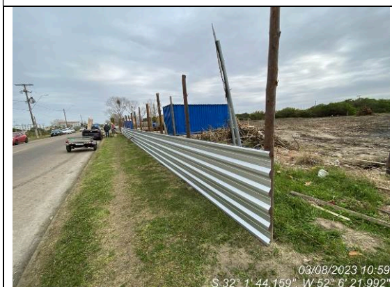
Dia 03/08 – Execução do tapume