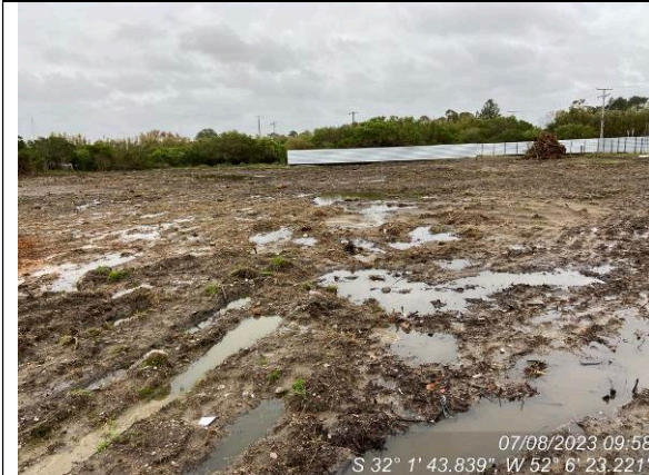
Dia 07/08 – Condição canteiro