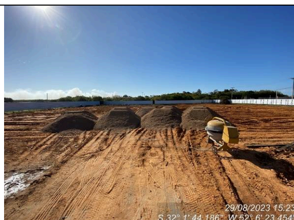
Dia 29/08 – Areia para camada drenante