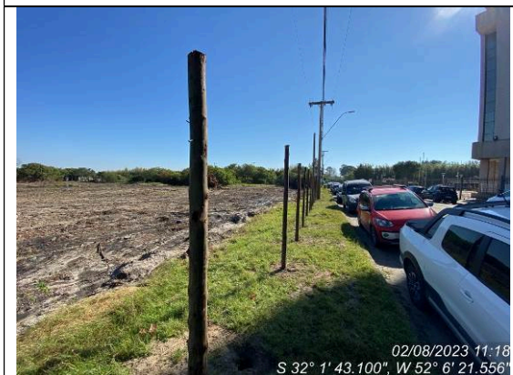
Dia 02/08 – Execução do tapume