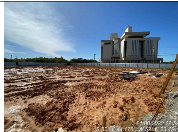
Dia 21/08 – Condição do canteiro