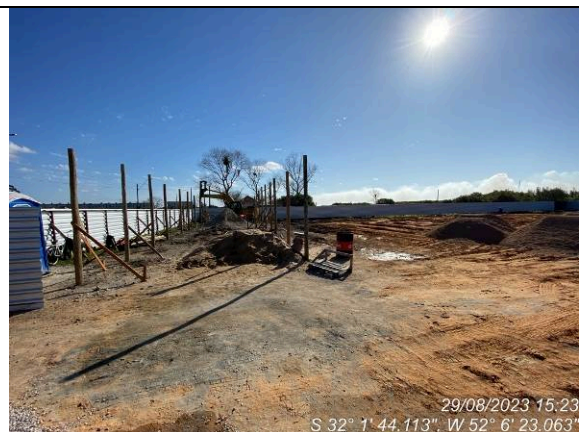
Dia 29/08 – Instalações provisórias