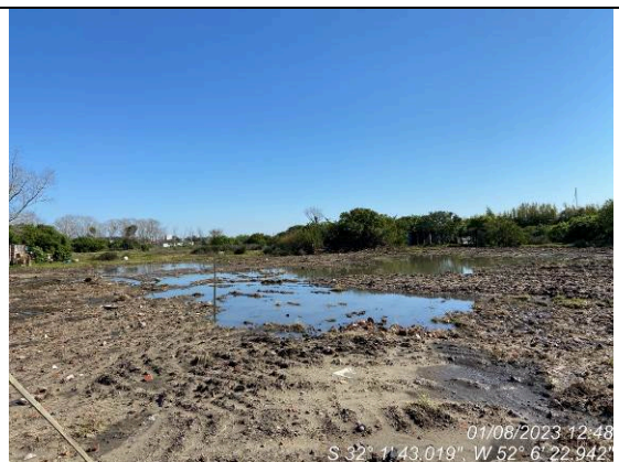
Dia 01/08 – Condição do canteiro