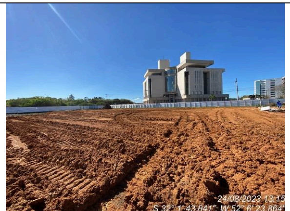
Dia 24/08 – Geral canteiro