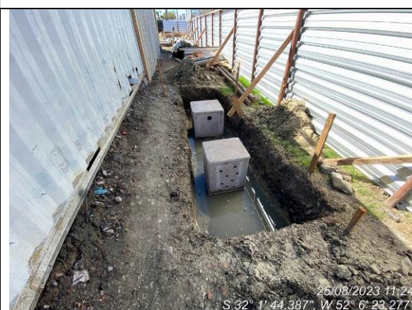
Dia 25/08 – Instalações provisórias