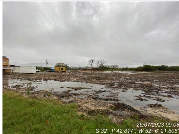
Dia 26/07 – Condição do canteiro pós chuva