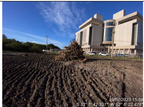
Dia 19/07 – Transporte da supressão vegetal