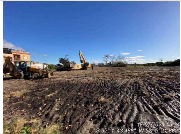
Dia 17/07 – Geral do canteiro