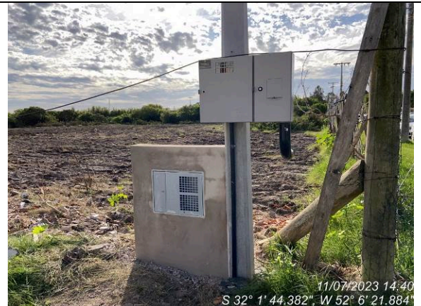
Dia 11/07 – Entrada de água padrão Corsan