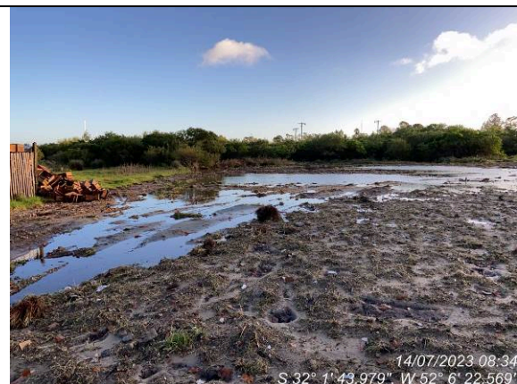
Dia 14/07 – Geral do canteiro após ciclone