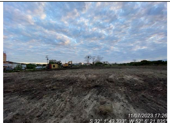
Dia 11/07 – Vista geral do canteiro