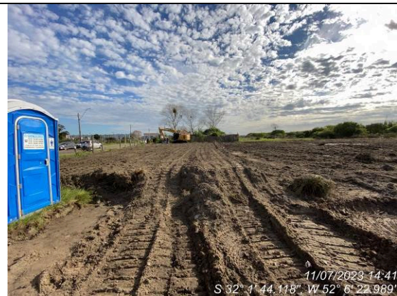
Dia 11/07 – Aterro para instalações do canteiro