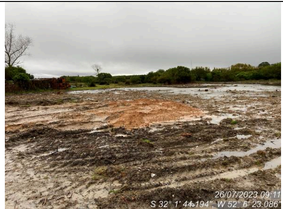
Dia 26/07 – Condição do canteiro pós chuva