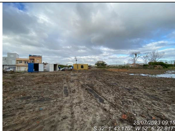
Dia 28/07 – Condição do canteiro