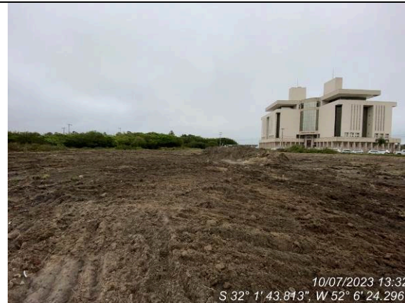
Dia 10/07 – Decapagem