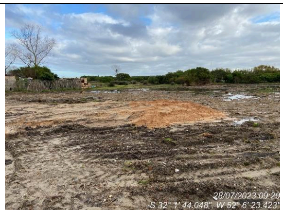
Dia 28/07 – Nivelamento do terreno paralisado desde 21/07/2023