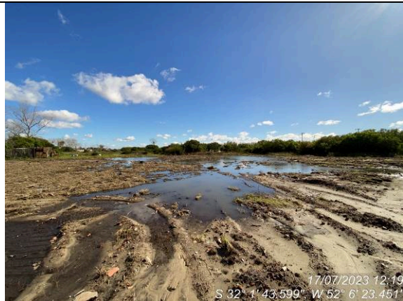
Dia 17/07 – Geral do canteiro