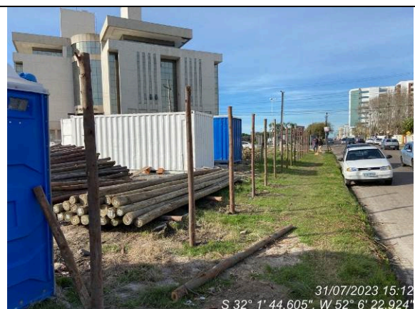
Dia 31/07 – Início da execução do tapume