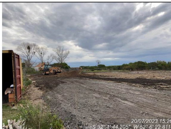
Dia 20/07 – Início nivelamento do terreno