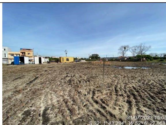
Dia 31/07 – Condição do canteiro