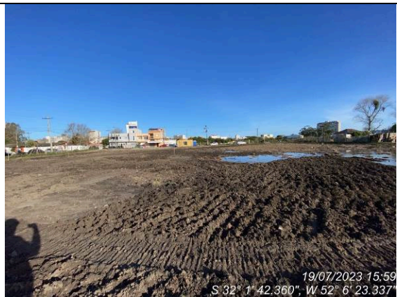
Dia 19/07 – Geral do canteiro