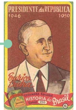
Eurico Gaspar Dutra, estampa do sabonete Eucalol

O ano de 1946 se inicia com mudanças na política nacional. Em 31 de janeiro, Eurico Gaspar Dutra , militar e ex-Ministro da Guerra, toma posse como presidente do Brasil. Famoso por sua liderança nas repressões à Intentona Comunista em 1935, Gaspar Dutra sobe à presidência candidatando-se pelo PSD (Partido Social Democrático) como o representante do Exército Brasileiro. Durante seu mandato, duas das questões mais importantes abordadas foram, além de muitas outras, a proibição dos jogos de azar no Brasil (Decreto-Lei nº 9.215) e a promulgação da Constituição de 1946 , oficializada em 18 de setembro.