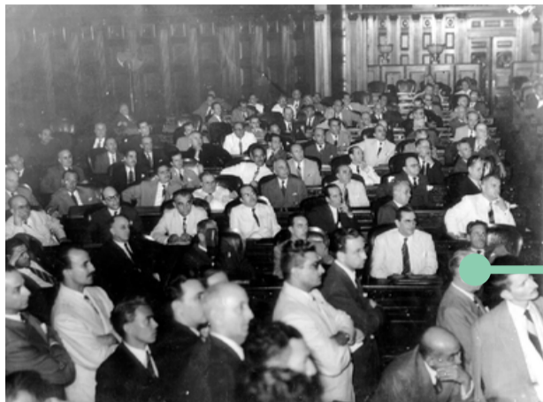
Assembléia Nacional Constituinte, 1946

O ano de 1946 se inicia com mudanças na política nacional. Em 31 de janeiro, Eurico Gaspar Dutra , militar e ex-Ministro da Guerra, toma posse como presidente do Brasil. Famoso por sua liderança nas repressões à Intentona Comunista em 1935, Gaspar Dutra sobe à presidência candidatando-se pelo PSD (Partido Social Democrático) como o representante do Exército Brasileiro. Durante seu mandato, duas das questões mais importantes abordadas foram, além de muitas outras, a proibição dos jogos de azar no Brasil (Decreto-Lei nº 9.215) e a promulgação da Constituição de 1946 , oficializada em 18 de setembro.