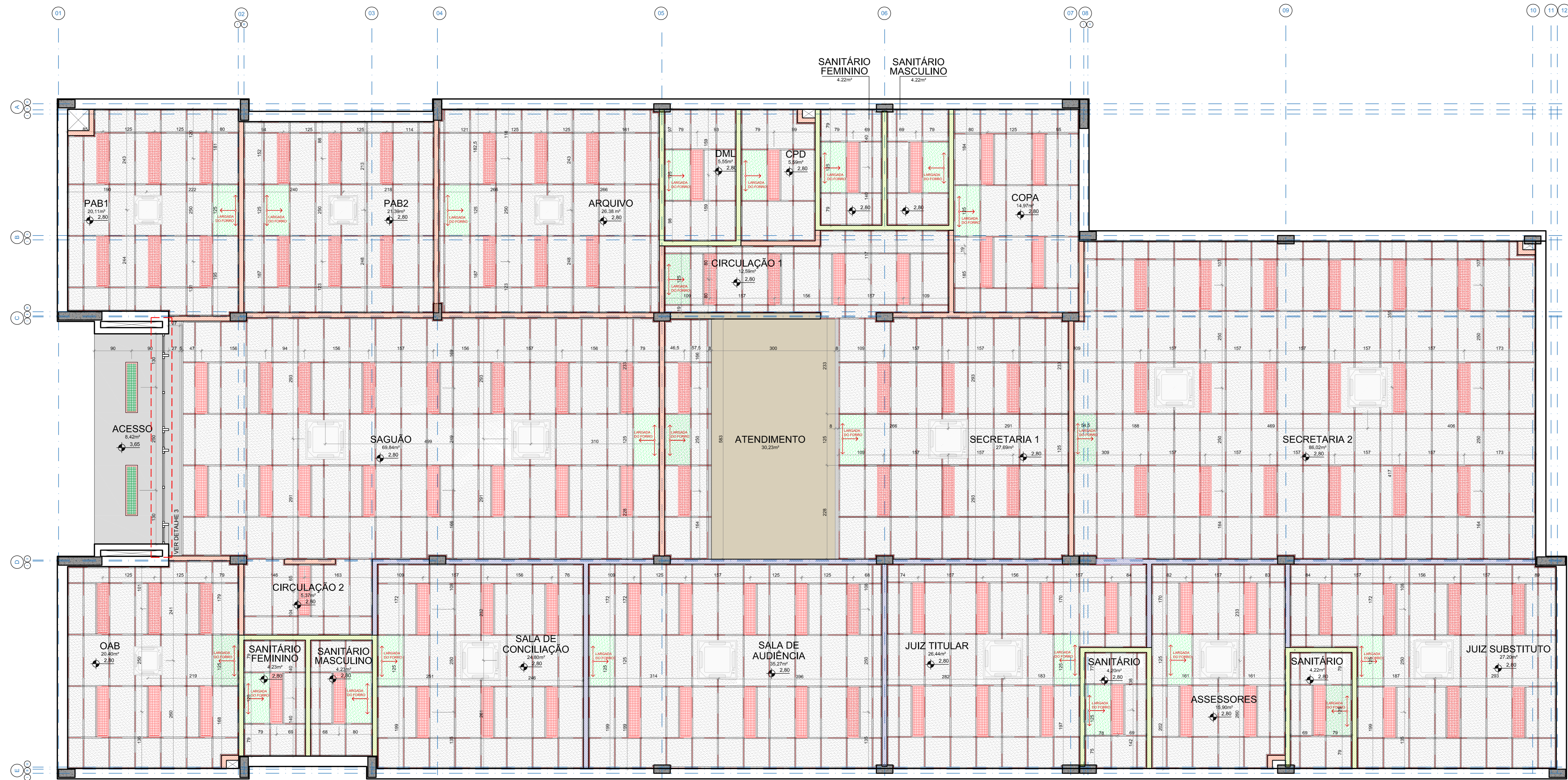
PLANTA DE FORRO ESCALA= 1/50