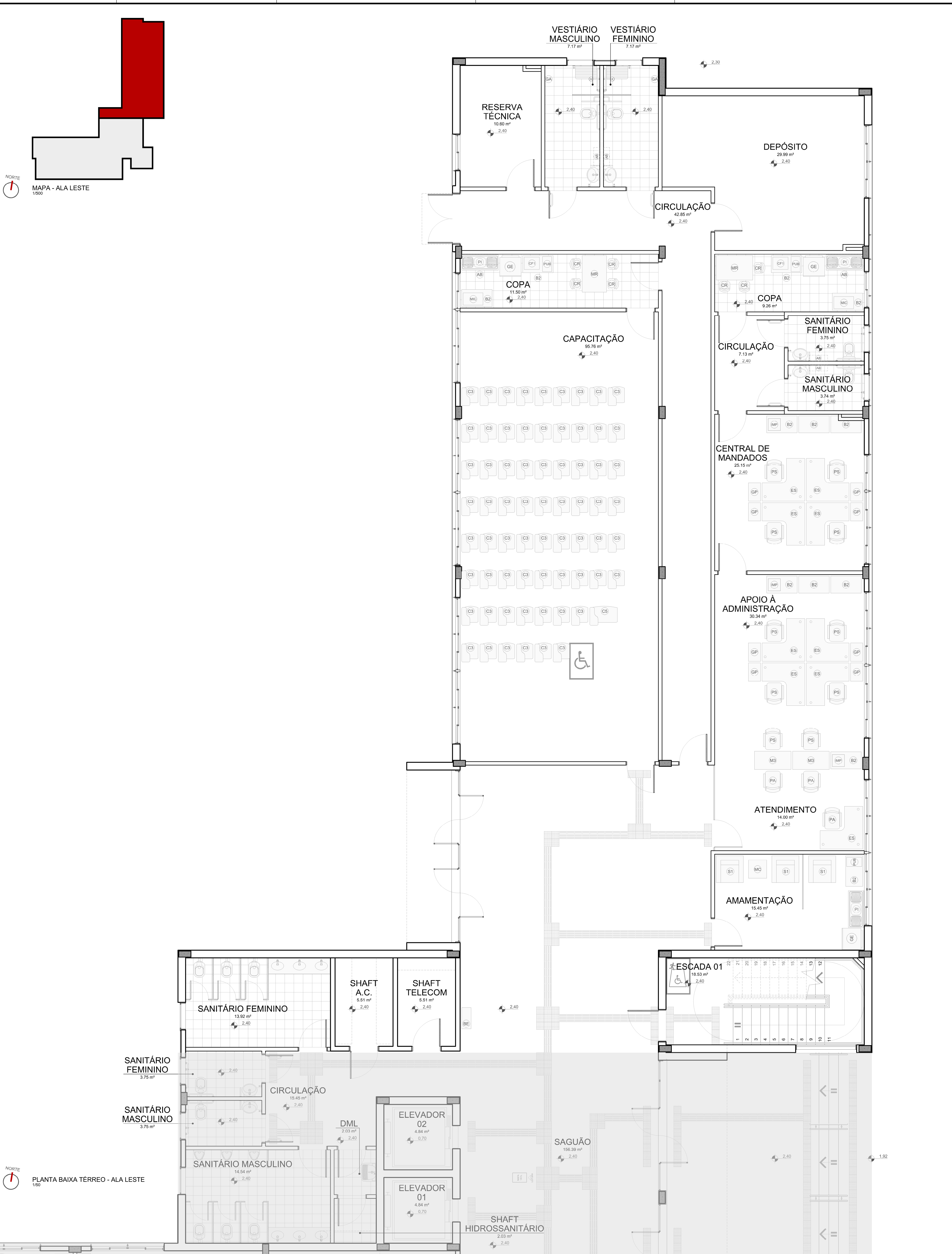
NORTE MAPA - ALA LESTE 1/500