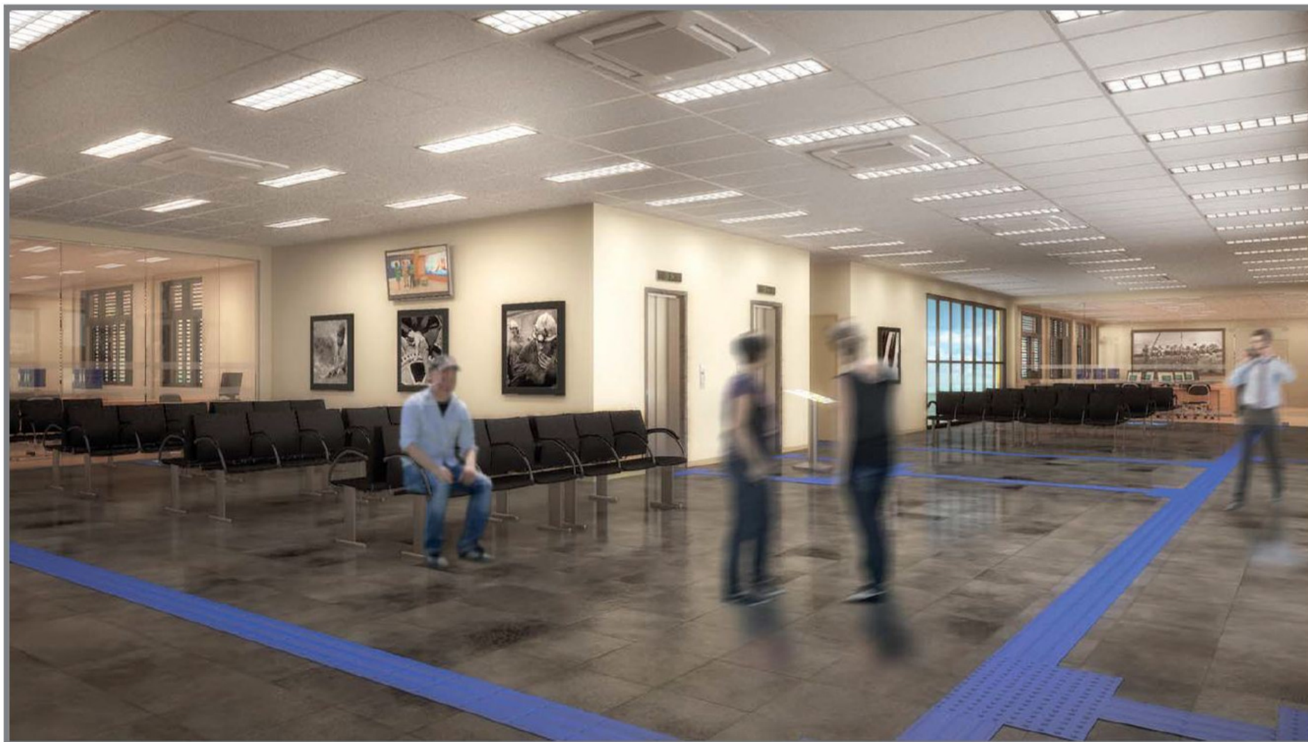
Saguão do Pavimento Tipo