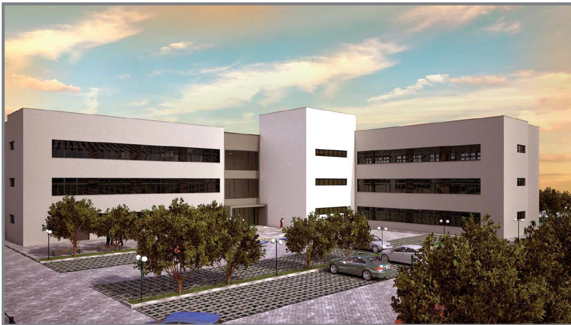
Perspectiva Noroeste (vista do estacionamento) - Fase 1