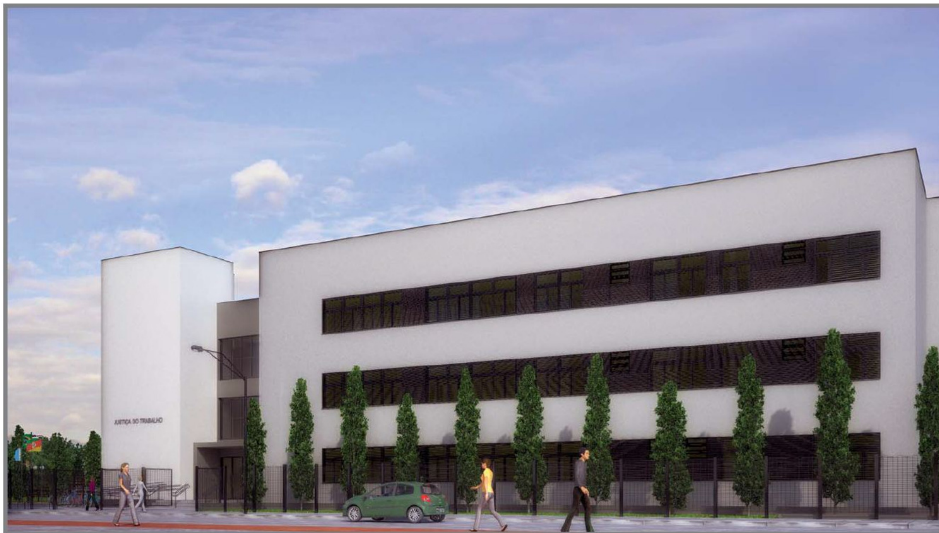
Perspectiva Noroeste (acesso principal) - Fase 1 e Fase 2