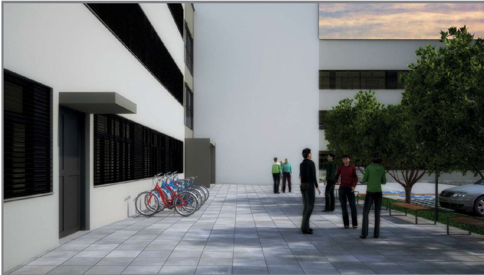
Acesso dos funcionários - Fase 1