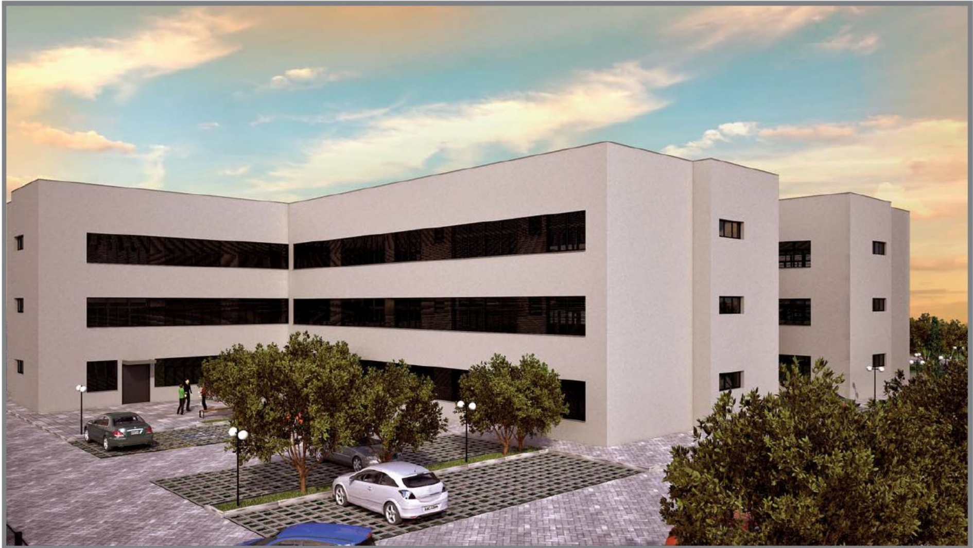
Perspectiva Noroeste (vista do estacionamento) - Fase 2