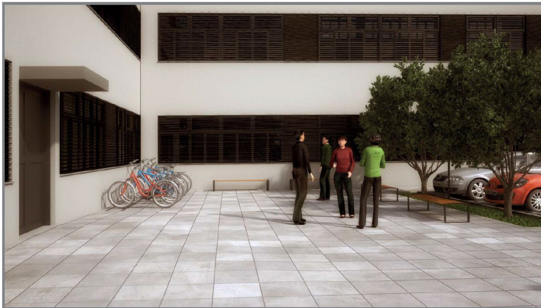
Acesso dos funcionários - Fase 2