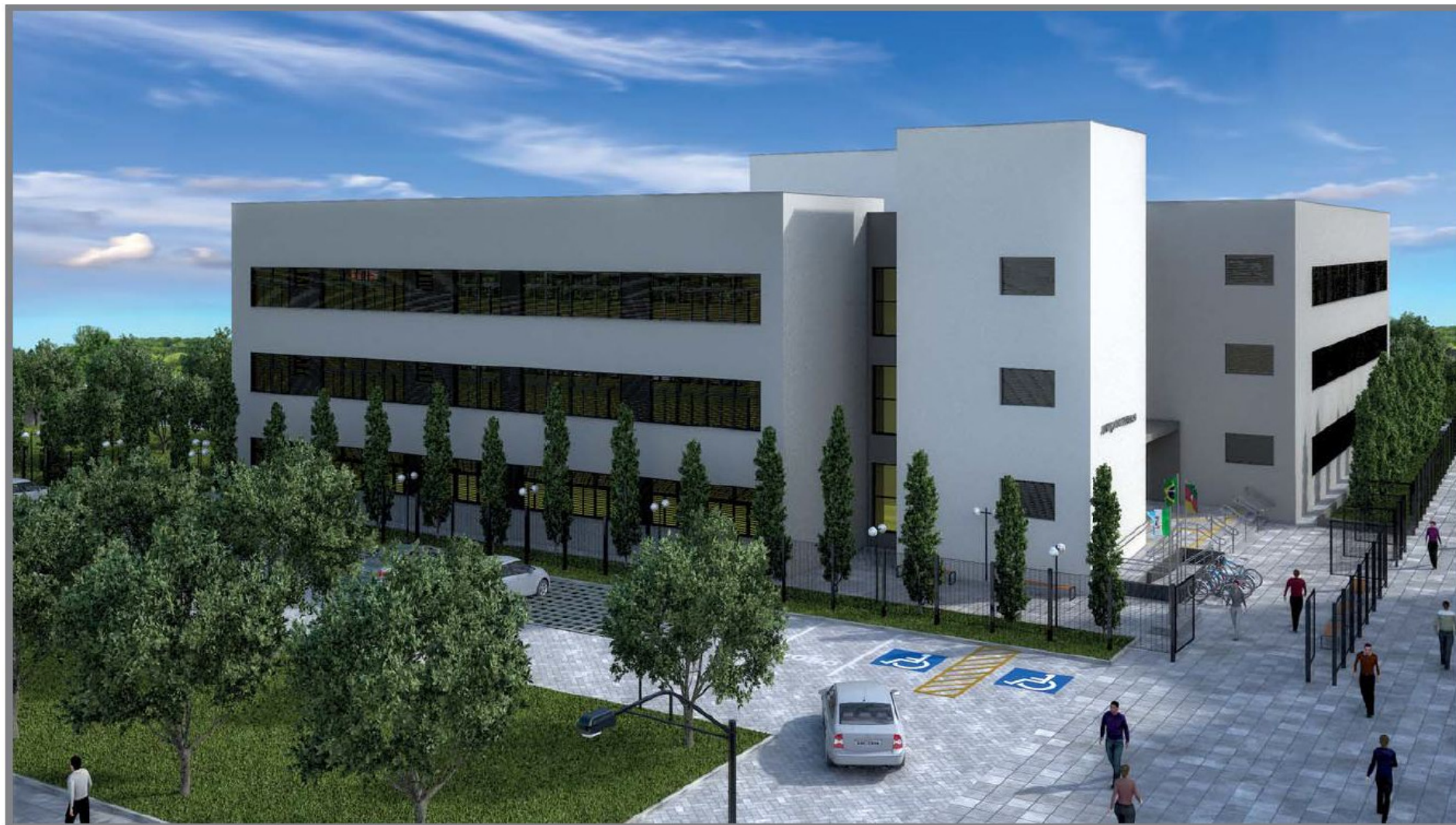
Perspectiva Sudeste (estacionamento público) - Fase 1 e Fase 2