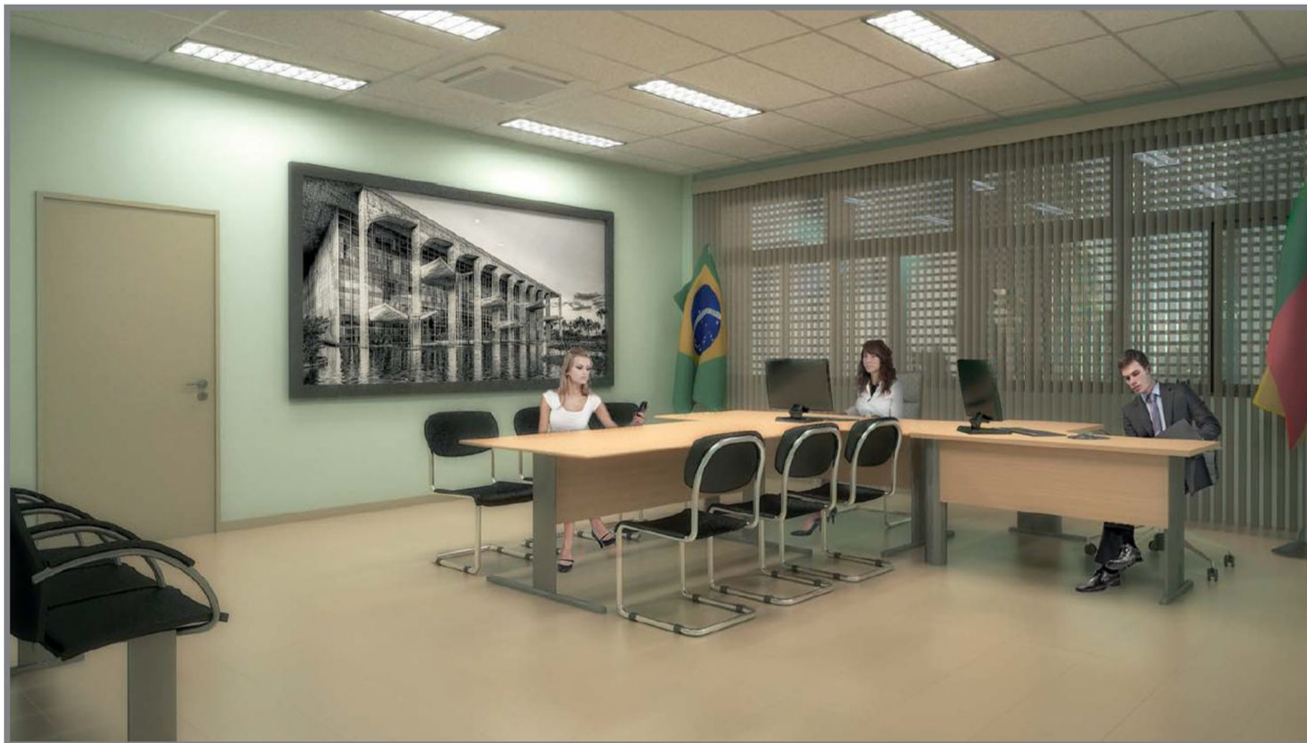
Sala de Audiências