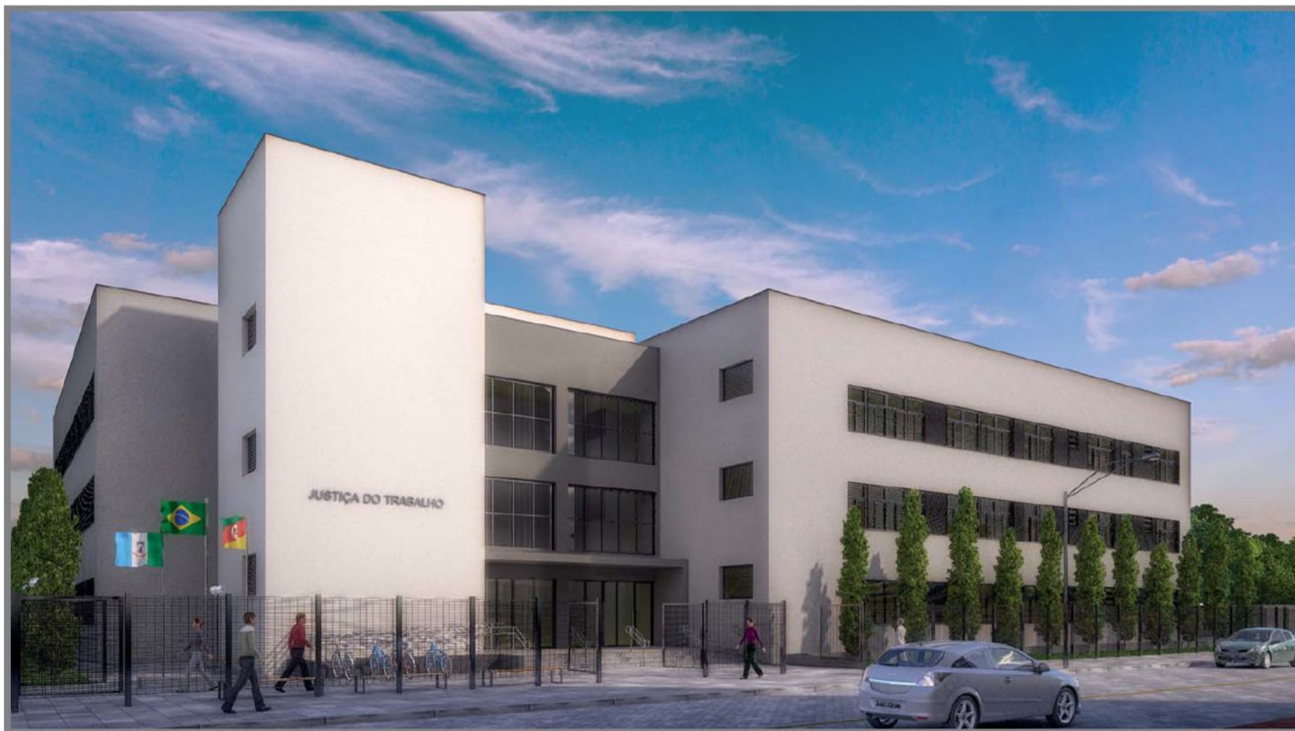
Perspectiva Leste (acesso principal) - Fase 1 e 2