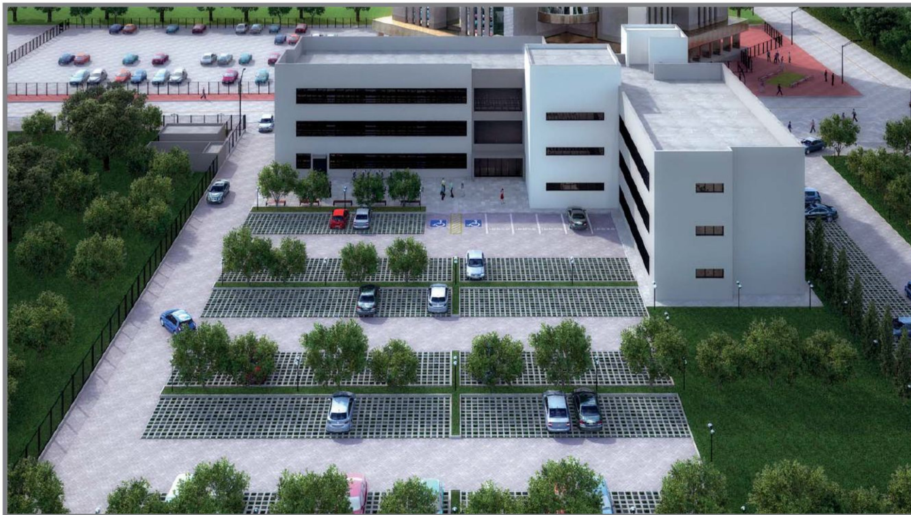
Perspectiva Oeste (estacionamento) - Fase 1