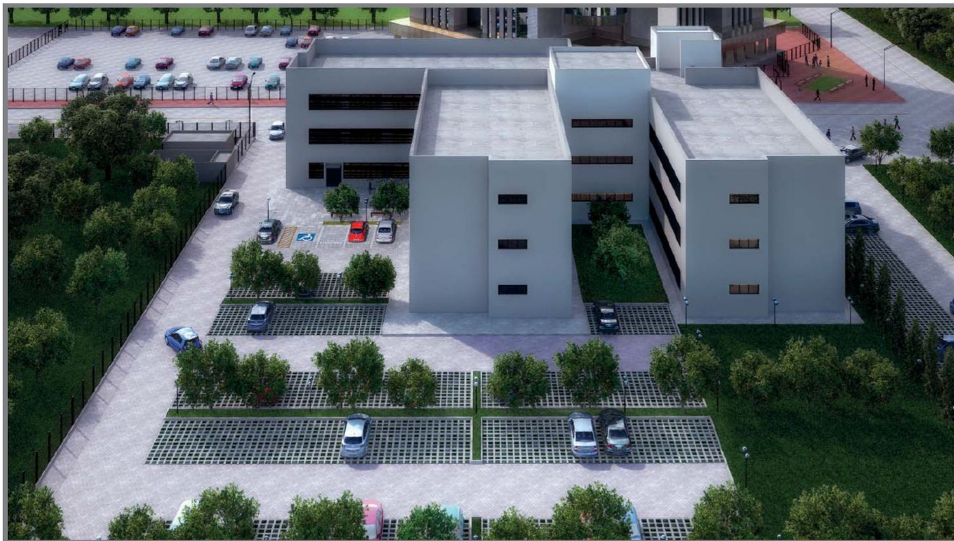
Perspectiva Oeste (estacionamento) - Fase 2