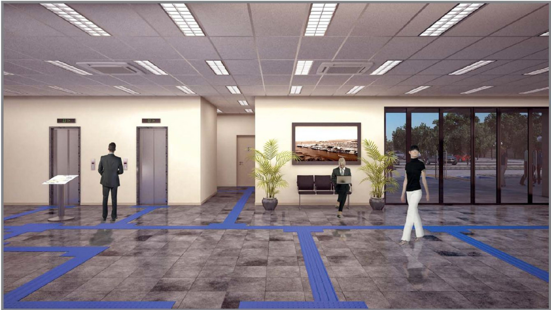
Saguão Principal (Térreo)